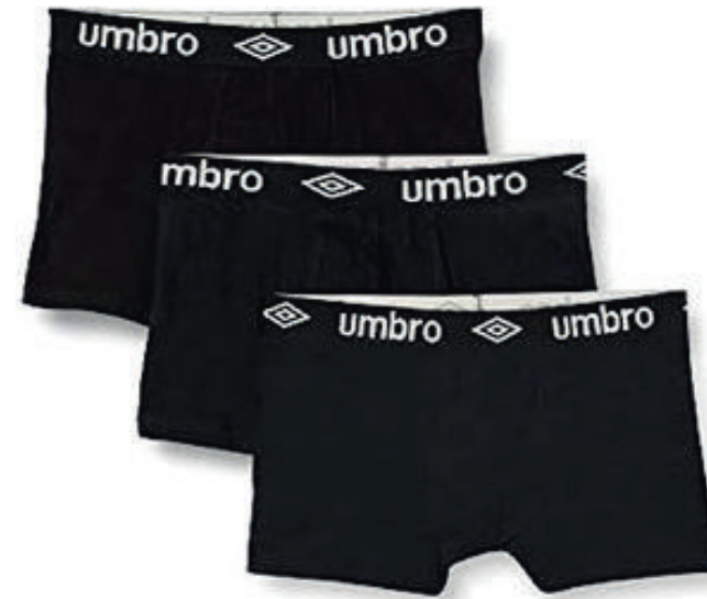
3 Pack -090 - black/white

Black Bestellnr.: UMUM0388-090 Multi: Bestellnr.: UMUM0388-LYP