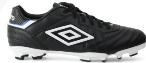
FZ9 Black/ White/ TW Royal