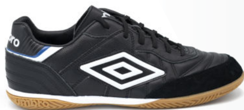
FZ9 Black/ White/ TW Royal