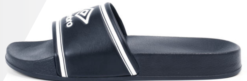
Dark Navy/ White