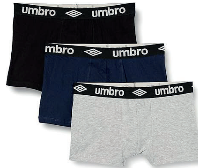
3 Pack - LYP - black/navy/grey marl