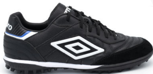
FZ9 Black/ White/ TW Royal