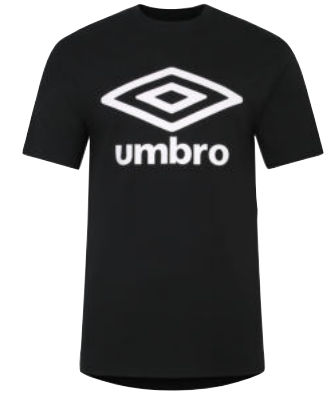
090 - black/white