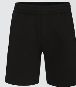
090 - black/white