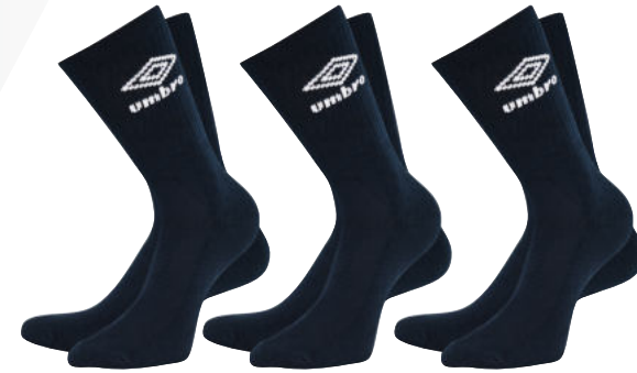
3 Pack -090 - black/white

white Bestellnr.: UMSM0181 - 096 black Bestellnr.: UMSM0181 - 090