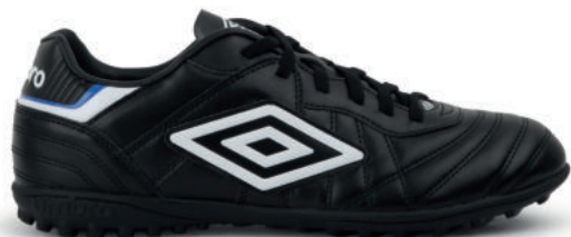
FZ9 Black/ White/ TW Royal