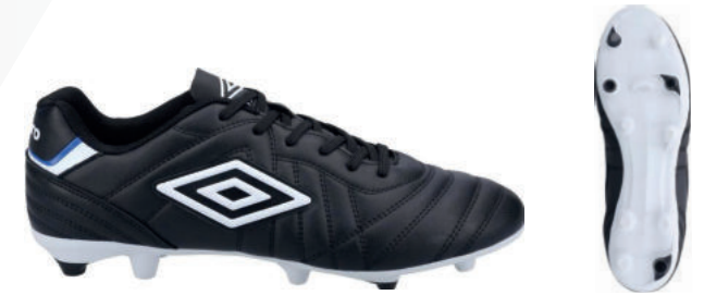
FZ9 Black/ White/ TW Royal