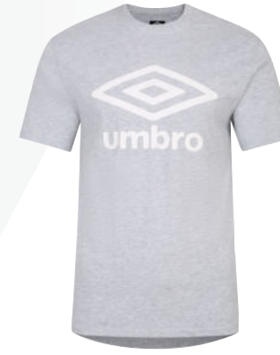
P12 - grey marl/white