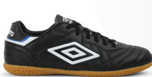
FZ9 Black/ White/ TW Royal