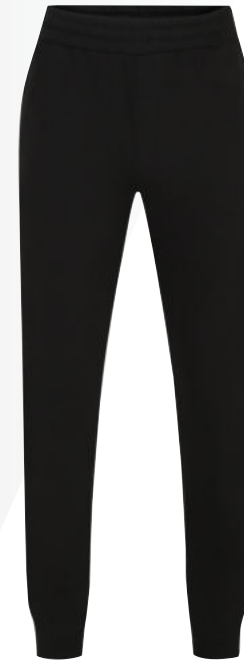
090 - black/white