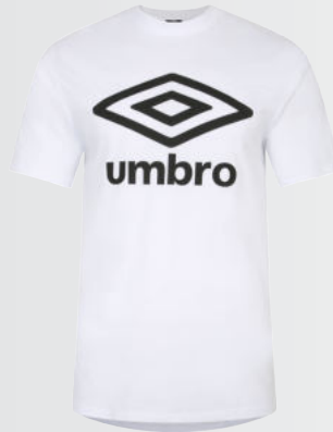
096 - white/black