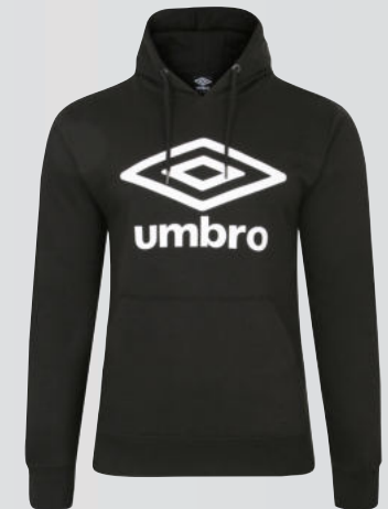
090 - black/white