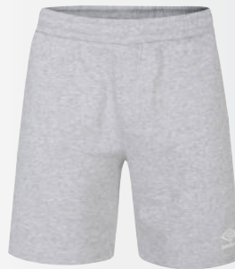
P12 - grey marl/white