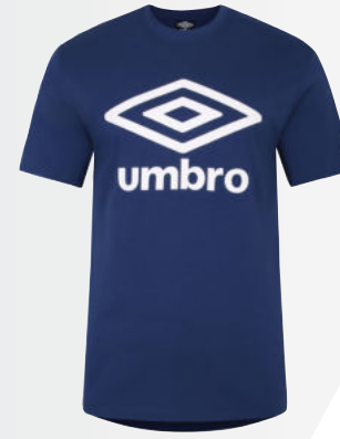
075 - navy/white