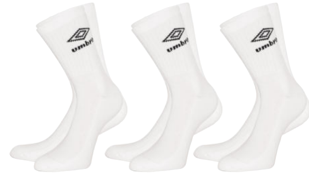
3 Pack -096 - white/black