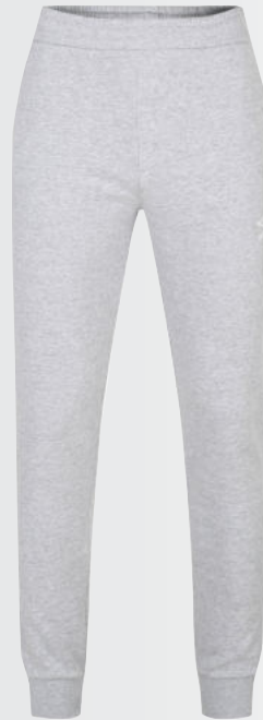
P12 - grey marl/white