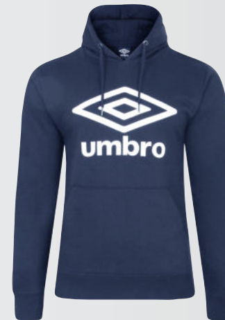
075 - navy/white