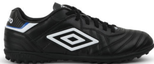
FZ9 Black/ White/ TW Royal