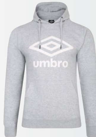
P12 - grey marl/white