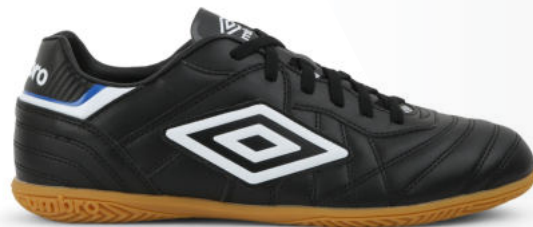
FZ9 Black/ White/ TW Royal